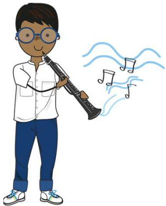
jouer d'un instrument