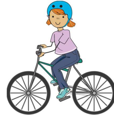
faire du vélo